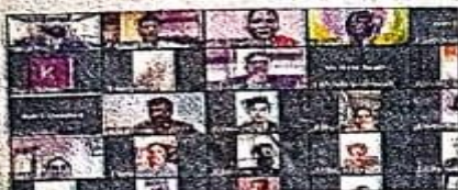
Guests and participants during the online conference.