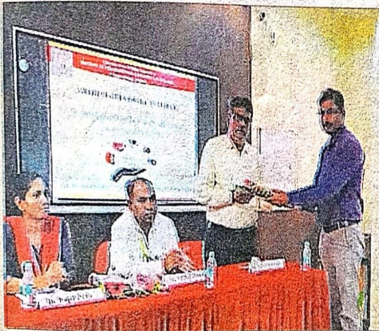
Glimpse of the programme.