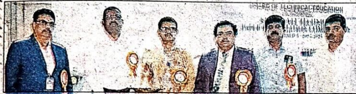
Guests present at the programme.